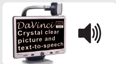
Ecran et caméra HD et lecteur vocal

Faites l'expérience unique de la haute définition et découvrez le plaisir de la lecture à haute voix grâce à son OCR intégré.